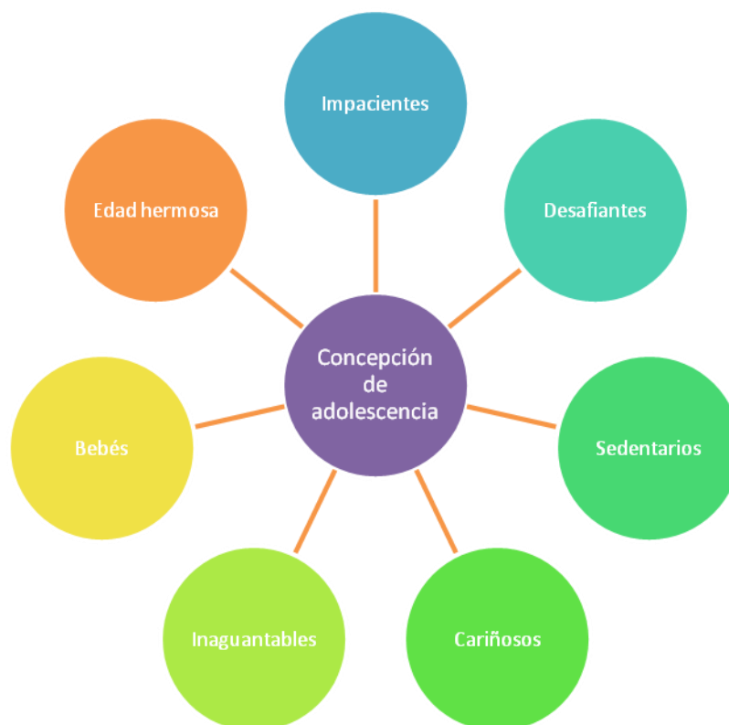
Gráfico 3: Concepción de la adolescencia

Al respecto, una de las entrevistadas plantea lo siguiente: