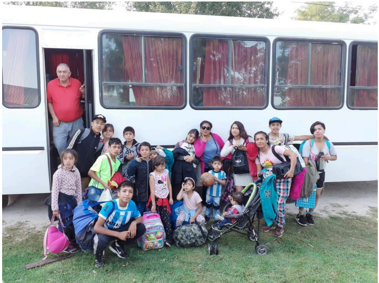
Salida del grupo de Parque Hermoso hacia la Unidad Turística de Chapadmalal en Marzo 2020