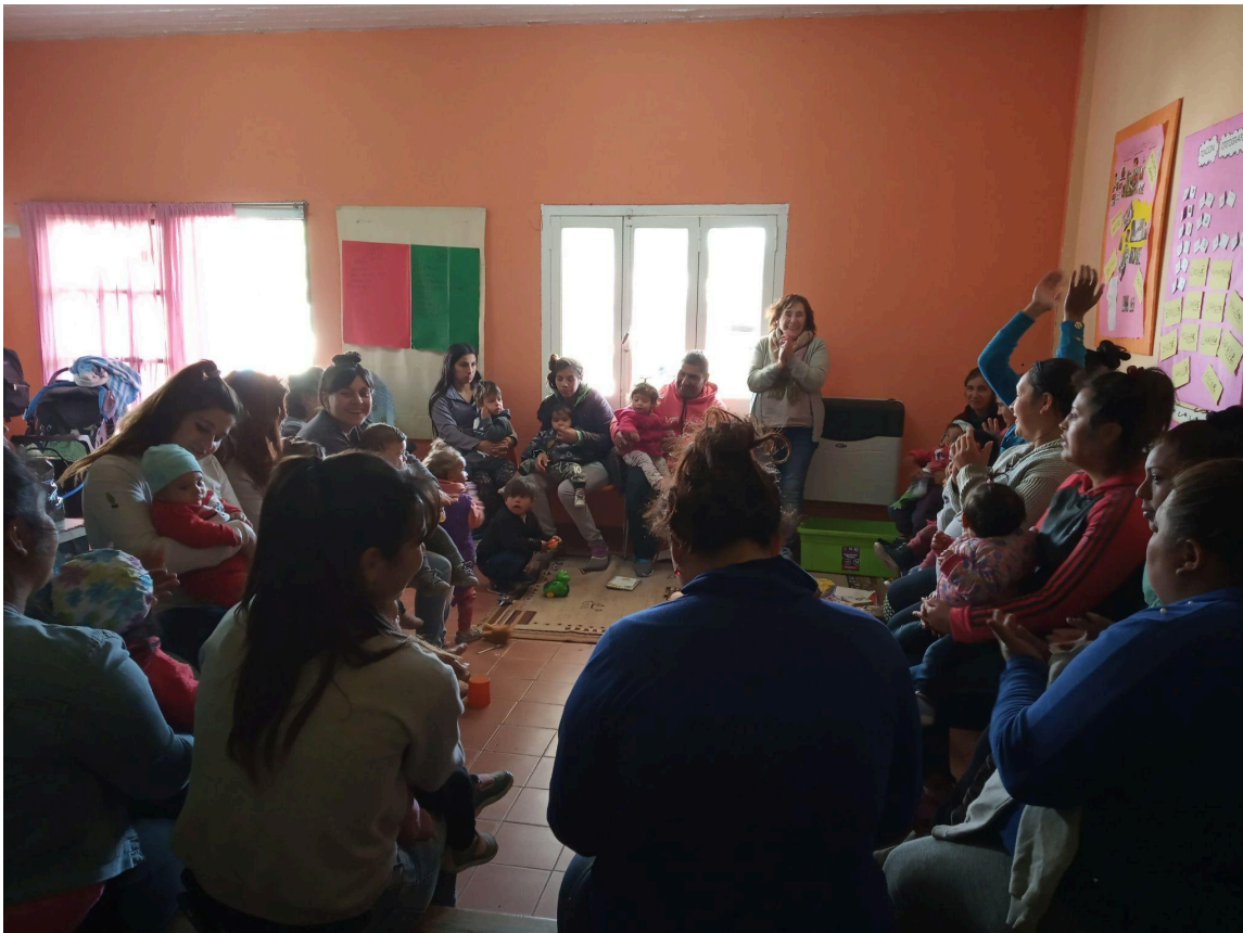
Mujeres y niños/as participantes del Taller de Estimulación Temprana del barrio Las Heras. Año 2019.