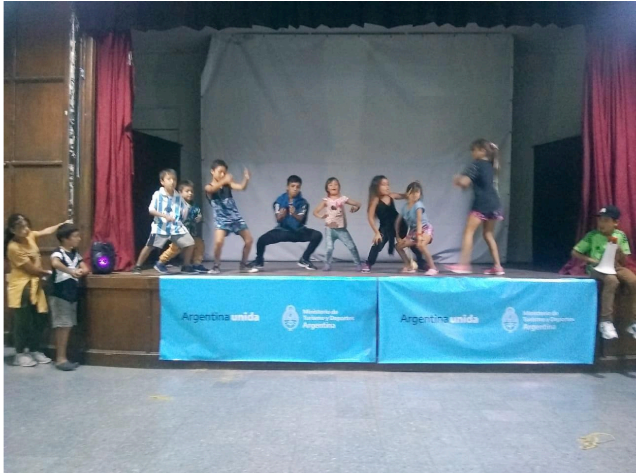
Ida a la Unidad Turística de Chapadmalal en Marzo 2020