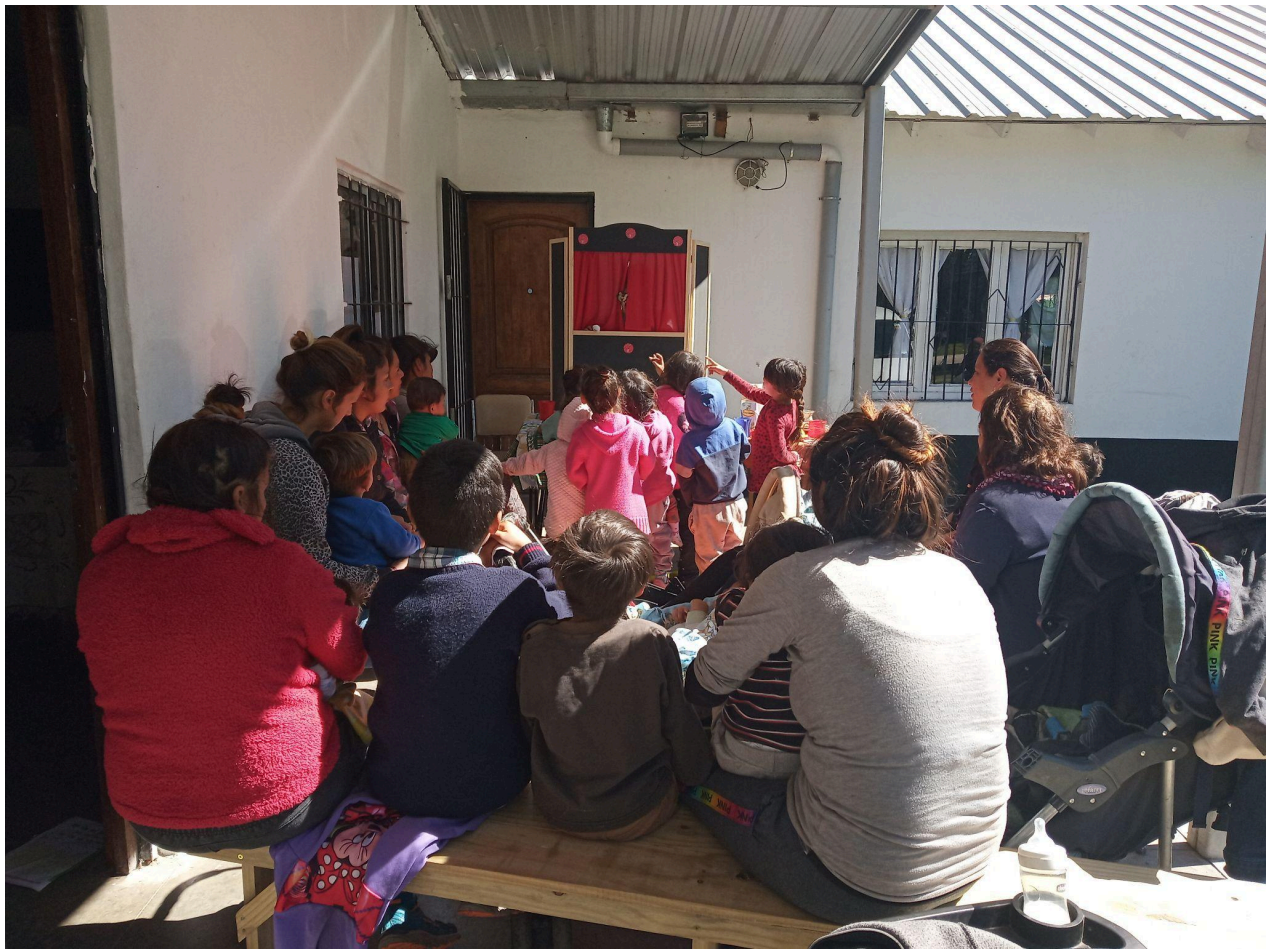
Mujeres y niños/as participantes del Taller de Estimulación Temprana del barrio Parque Hermoso. Año 2019.