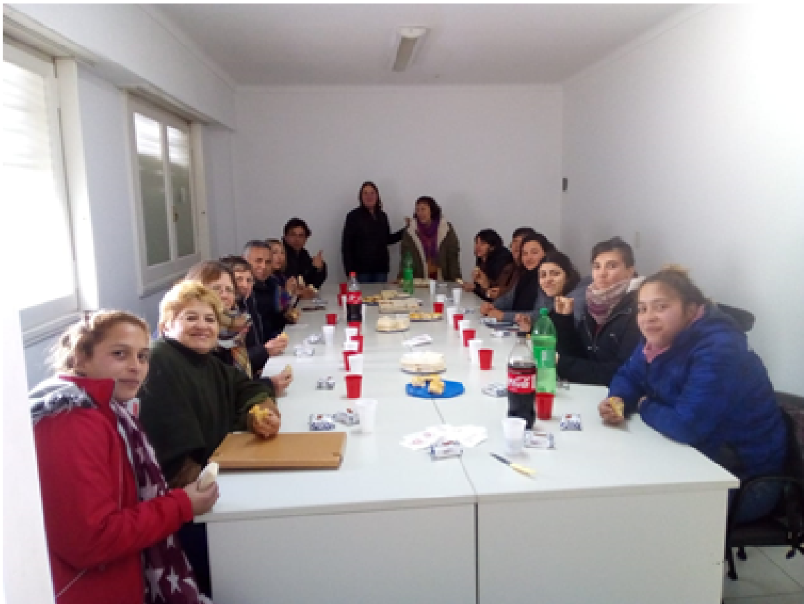
Equipo de trabajo del Proyecto Betania (2019-2020)