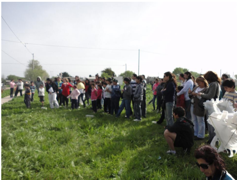
Niños, Jovenes, Integrantes de la Red Libertad, Docentes y Padres que participaron del proyecto “Construimos Libertad I”. Año 2011.