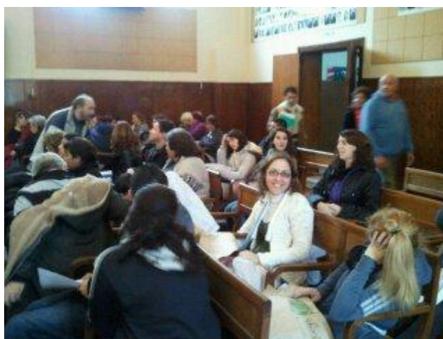
Representantes de la Red Barrial Libertad, alumnos de la UNMDP y vecinos de la comunidad del barrio Libertad, a la espera de la exposición ante los concejales del HCD, Banca 25. Año 2012.