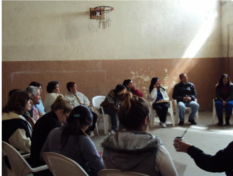
Plenario en escuela Pierre Marie con los adultos de la comunidad del barrio Libertad. "Foro de Adultos". Año 2010.