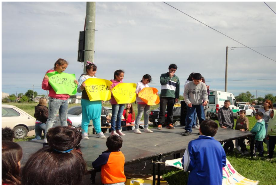
Niños exponiendo lo trabajado ante los jóvenes y adultos de la comunidad del barrio.