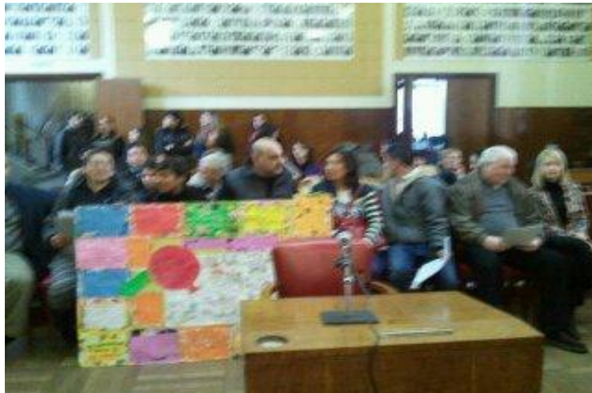
Presentación de proyectos del Foro de Adultos en el HCD, Banca 25. Año 2010.