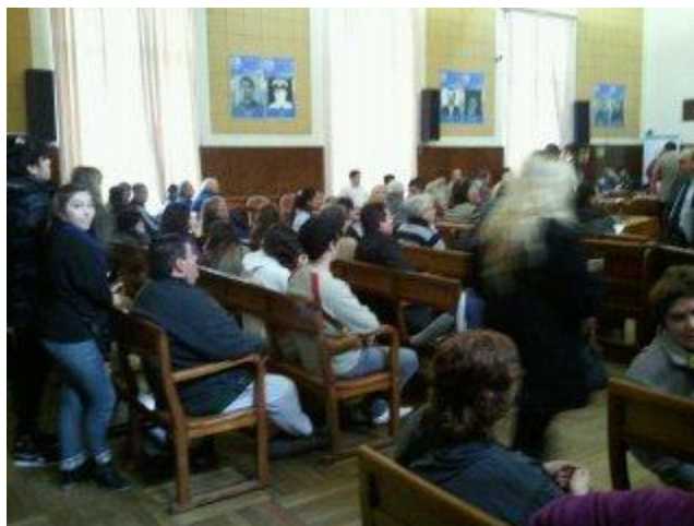
Presentación de Proyectos “Construimos Libertad I” (año 2011). Exposición realizada en junio de 2012 en el HCD, Banca 25.