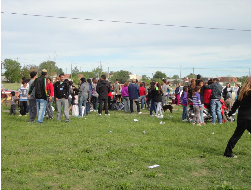
Niños, Jóvenes y Adultos que participaron del proyecto “Construimos Libertad II”. Año 2012.