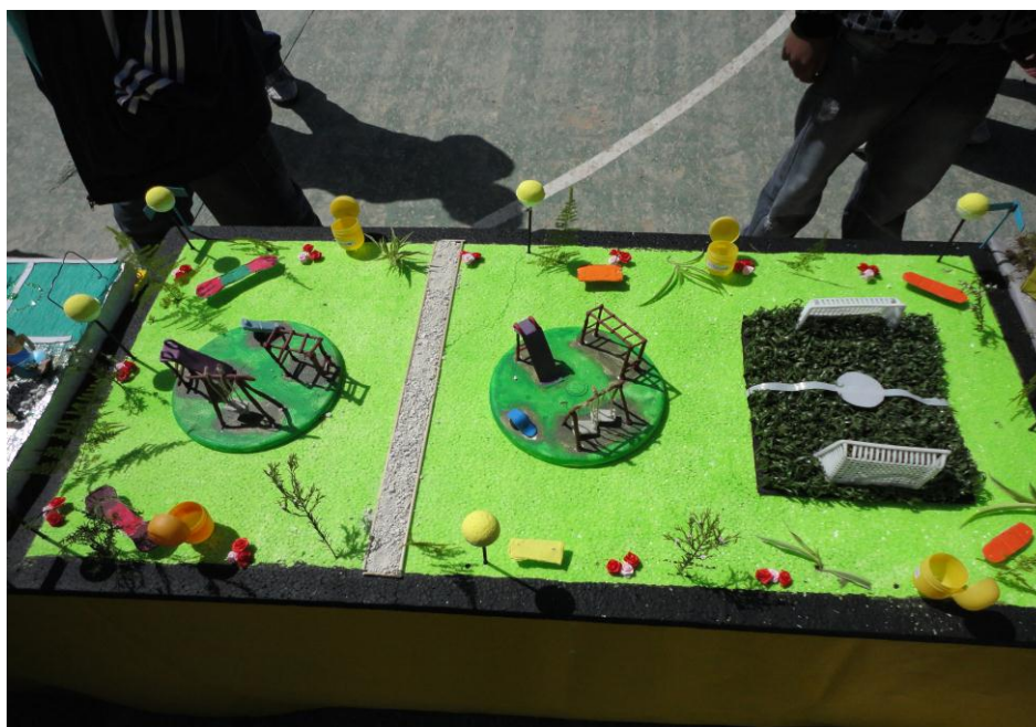
Maqueta en la cual se visualiza el proyecto donde se solicita una plaza con el equipamiento para realizar deportes.