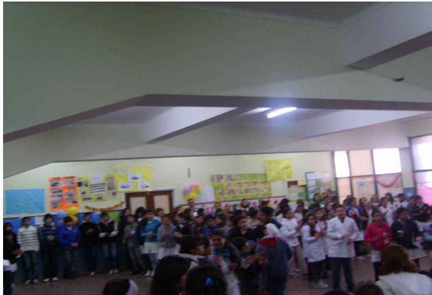
Niños y jóvenes que participaron de Foro de Niñez y Juventud ¿Qué tenes para decir? Año 2009.