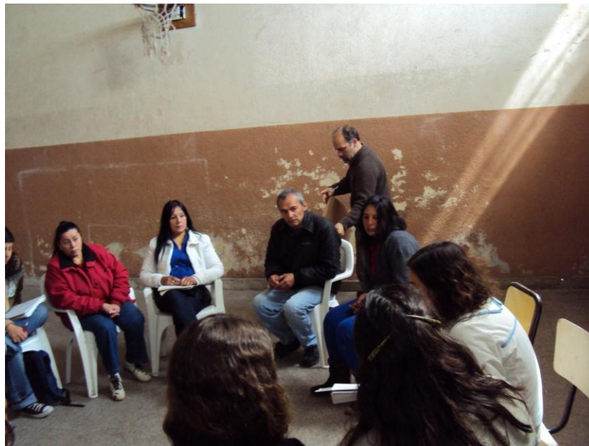
Exposicion de lo trabajado, y debate sobre las problematicas del barrio y sus posibles soluciones. "Foro de Adultos". Año 2010.