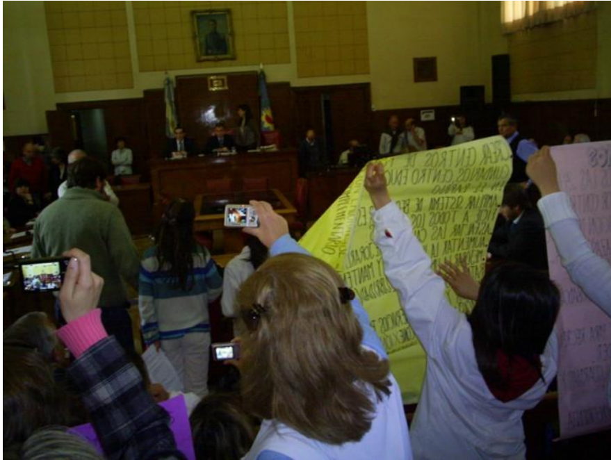
Presentación de proyectos del Foro de Niñez y Juventud en el HCD, Banca 25. Año 2009.