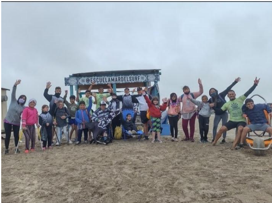
Imagen 1. Escuela MardelSurf en Puerto Cardiel, Mar del Plata

Para favorecer la comprensión del contexto de investigación, se consideró necesario graficar, a través de imágenes, la Escuela MardelSurf y los dispositivos que en la misma se utilizan para la práctica de surf adaptado.