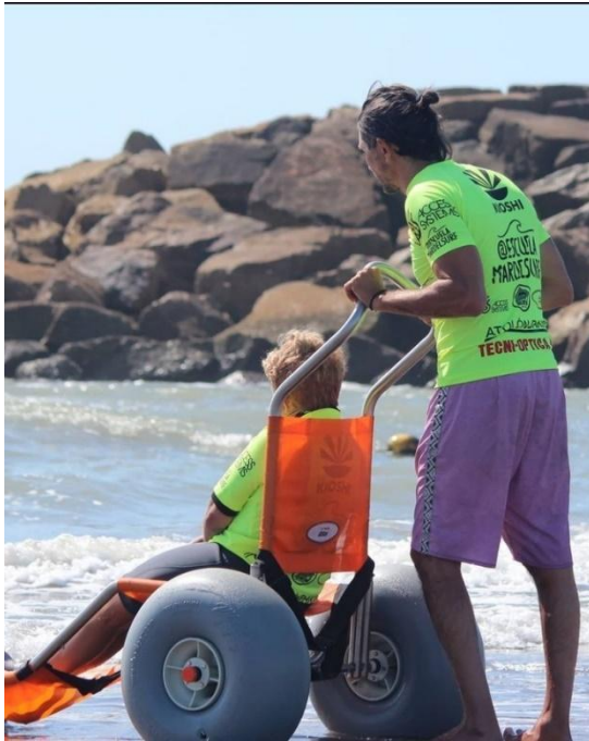
Imagen 6. Silla anfibia utilizada en la Escuela MardelSurf