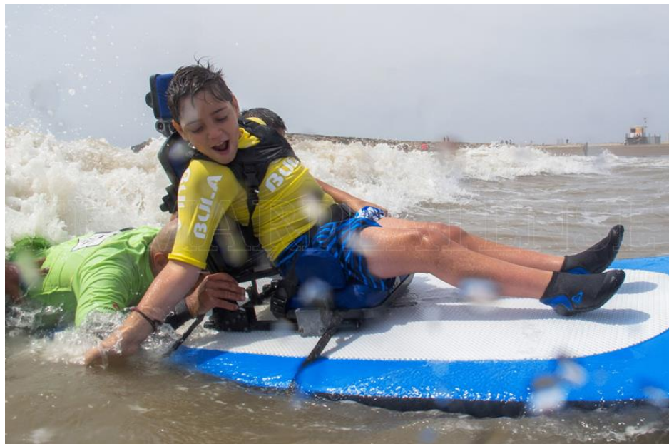
Imagen 4 y 5. Tabla con silla postural