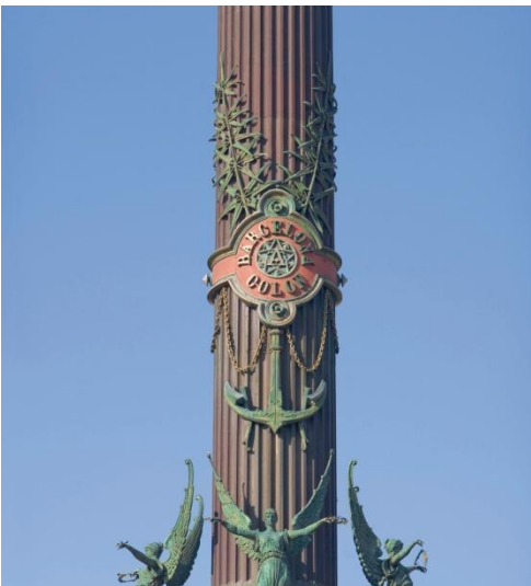
Figura 2: Monumento a Colón, imagen extraída (URL) https://hashmuseum.com/es/coleccion/colon-y-el-cannabis