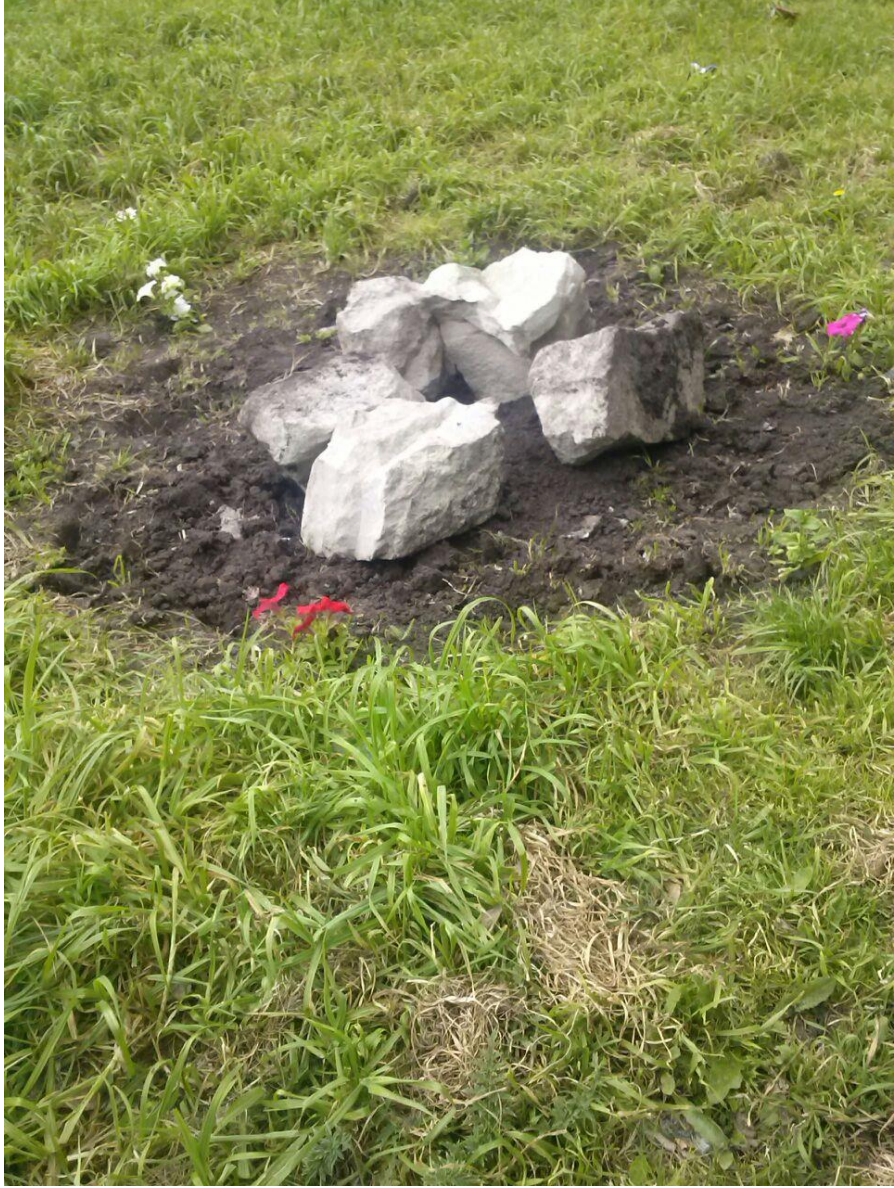
H Apacheta ubicada en el parque de la escuela