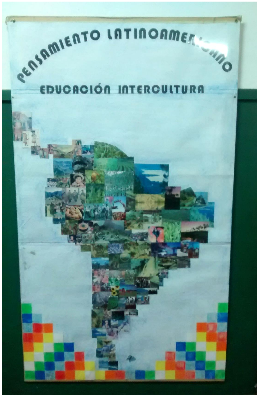
B Cuadro realizado por los alumnos de la institución