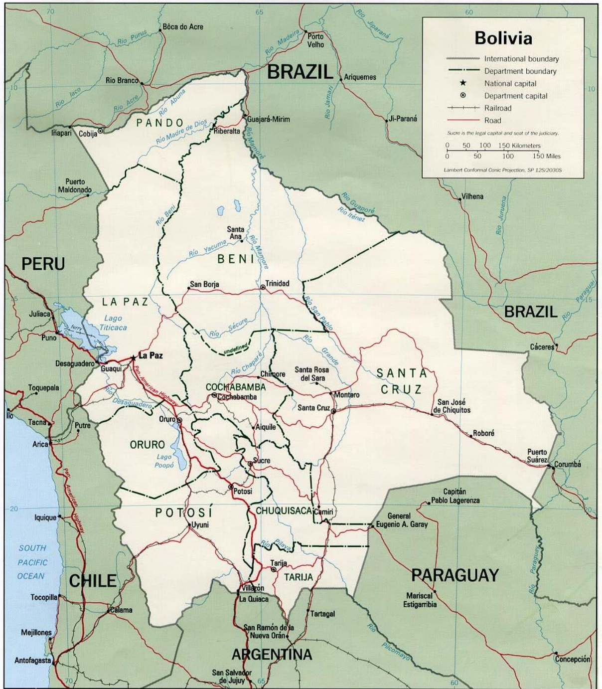
Base 802148 (R00815) 11-93