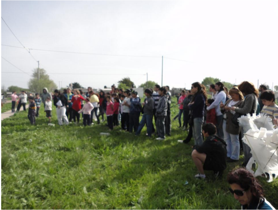
Niños, Jovenes, Integrantes de la Red Libertad, Docentes y Padres que participaron del proyecto “Construimos Libertad I”. Año 2011.