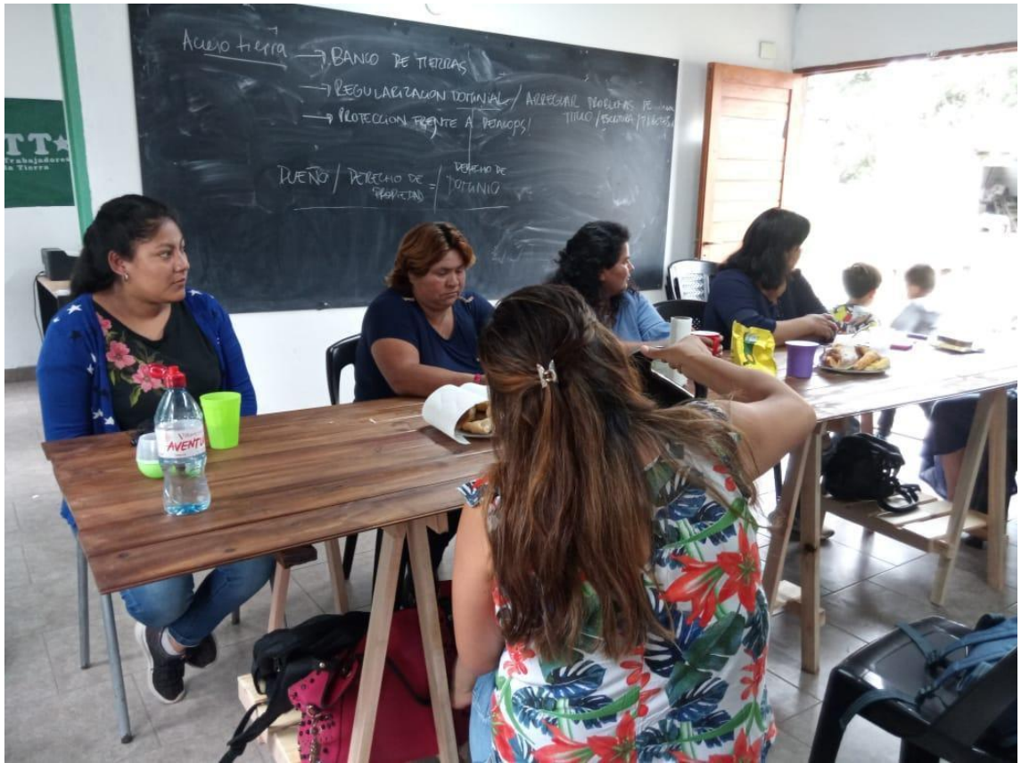
Foto tomada por la autora de unos de los encuentros mensuales de las promotoras.