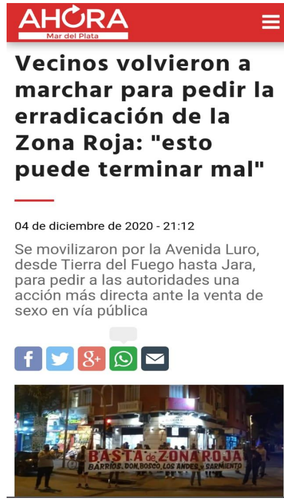
Ilustración 2

Ilustración 1