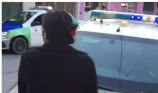
Ilustración 5 https://ahoramardelplata.com.ar/video-la-reaccion-los-vecinos-la-detencion-una-trans-plena-protesta-n4222025